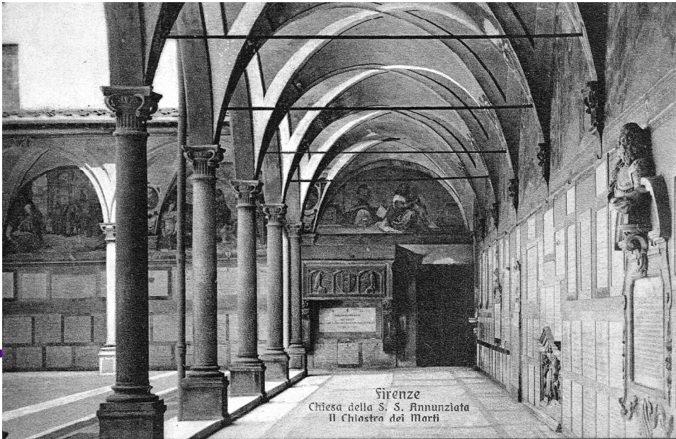
Una bella cartolina del chiostro Grande della SS. Annunziata, sec. XX.